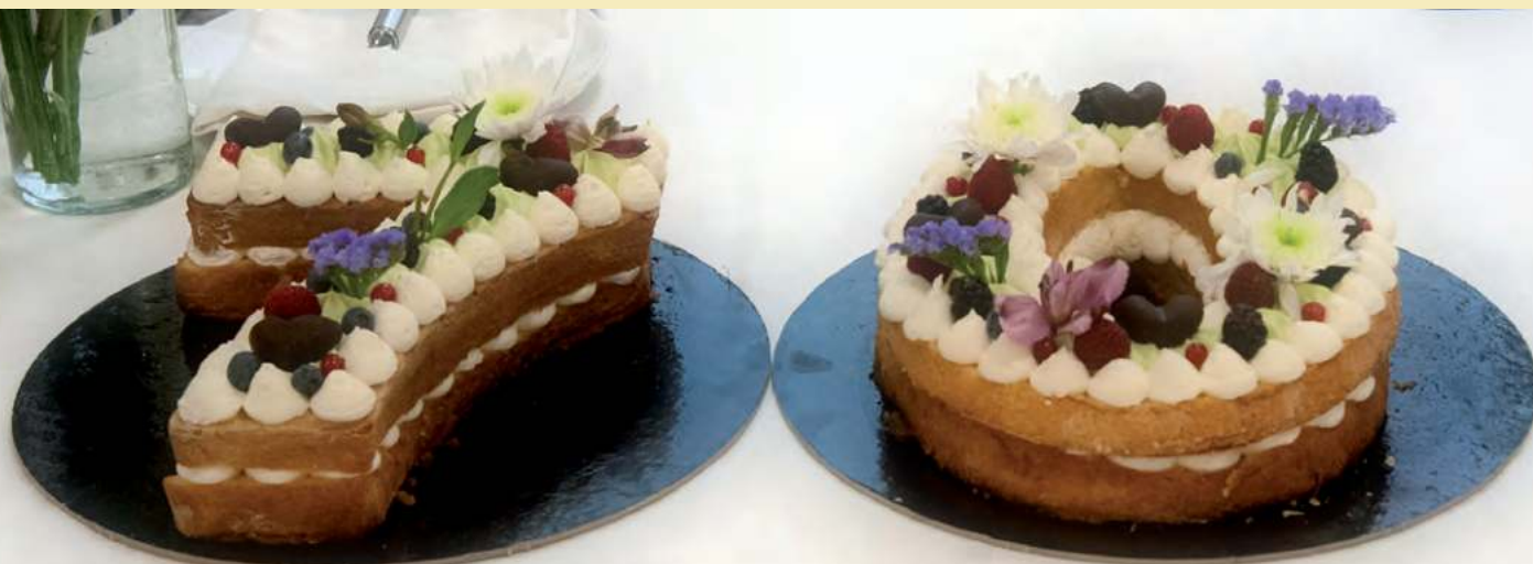
Torta realizzata dagli studenti dell Casa di Reclusione di Ranza in occasione dei festeggiamenti per il 70° anniversario dell'IIS Ricasoli

L' offerta formativa dell'IIS Ricasoli presso la Casa di Reclusione di Ranza testimonia la volontà , da parte della Scuola e delle Istituzioni , di offrire un percorso di eccellenza ai detenuti della struttura. Le competenze offerte dalla Scuola risultano, infatti, essere facilmente spendibili sul mercato dal punto di vista occupazionale e per reinserimento dei detenuti vista anche la vocazionalità del territorio.